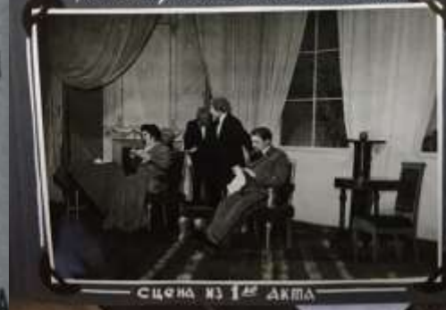
СЦЕНА ИЗ 1 го АКТА