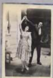
Сцена из 1-го

Муниципальный клуб Сальского городского округа