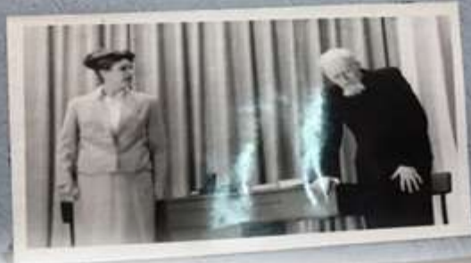
СЦЕНА ИЗ СПЕКТАКЛЯ "МАШЕНЬКА" АФИНОГЕНОВА